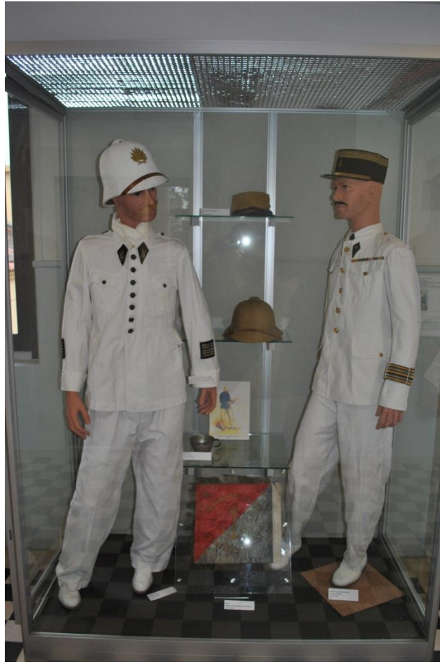
MANNEQUIN D’INTENDANT MILITAIRE DES TROUPES COLONIALES AUX COLONIES 1929